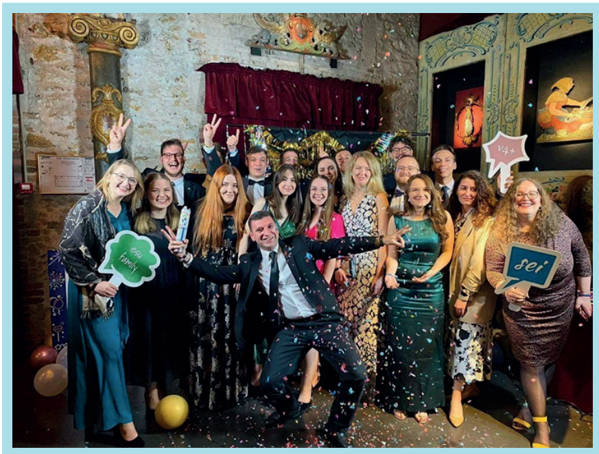
Oslavy 40. výročí ESU