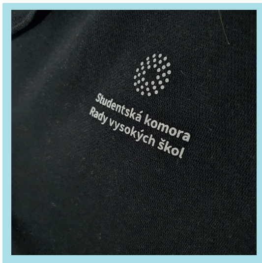
Mikina SK RVŠ

Pracovní skupina pro PR byla zapojená do příprav zadávací dokumentace pro zpracování nového webu SK RVŠ a výběrového řízení pro zpracovatele vzhledu webu Komory. V novém vizuálu byly vytvořeny i reklamní předměty SK RVŠ pro aktivity Komory a její prezentaci.