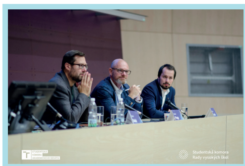
Panelová diskuse na KAS 9.0