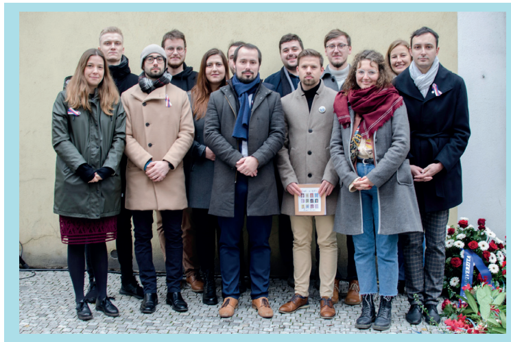
SK RVŠ u památníku J. Opletala a V. Sedláčka