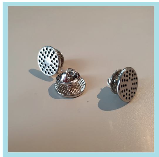
Odznáček do klopý SK RVŠ