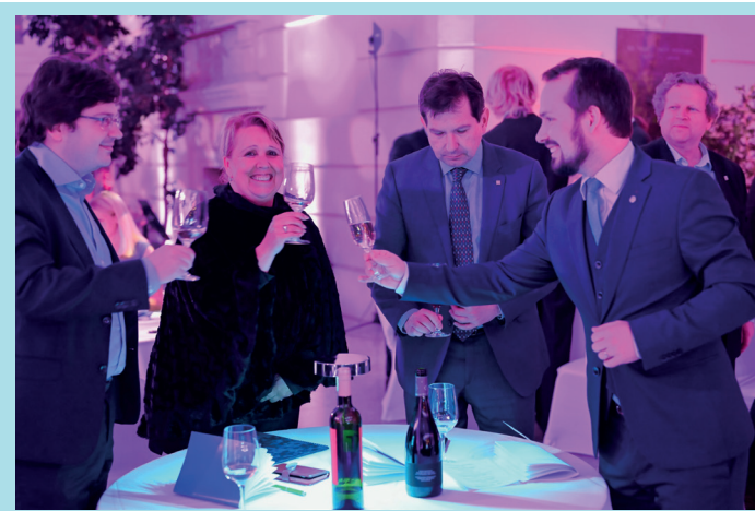
Účastníci oslav 30 let SK RVŠ