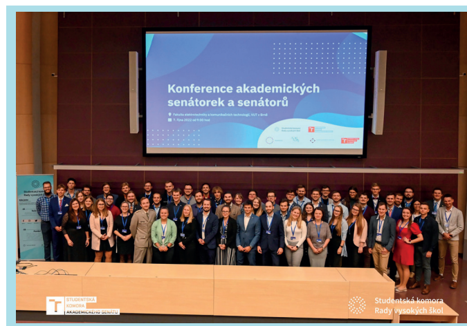
Účastníci KAS 9.0