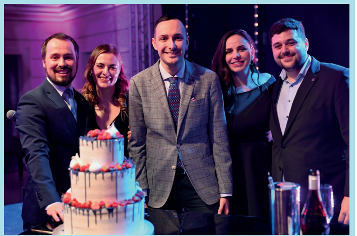
Předsednictvo a sekretariát SK RVŠ