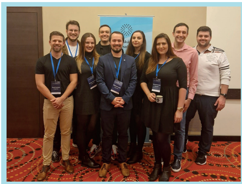
Organizační tým 83. Valného shromáždění ESU