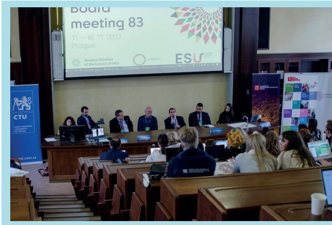
Seminární část 83. Board meetingu ESU VŠCHT v Praze

Plenární část proběhla v hotelu DUO. Během plenární části bylo přijato několik usnesení, jedno z nich bylo zaměřeno na digitalizaci a student-centered learning, které by dále mělo umožňovat flexibilní možnosti studia, co se týče složení studijního programu i jeho formy. Další usnesení se věnovalo evropským univerzitním aliancím. V souvislosti s tím, že řada univerzit není součástí žádné aliance, je třeba zajistit, aby nedošlo k dvourychlostnímu rozvoji vzdělávacích systémů.