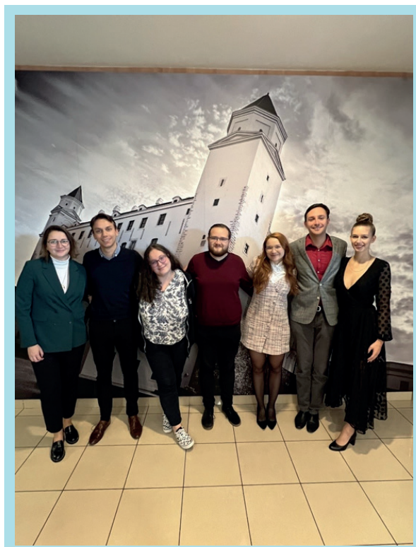
Školení Quality Assurance Student Expert Training

V návaznosti na tato setkání navázala SK RVŠ spolupráci se Slovenskou akreditační agenturou pro vysoké školství v oblasti náboru nových hodnotitelů pro akreditační řízení na Slovensku.