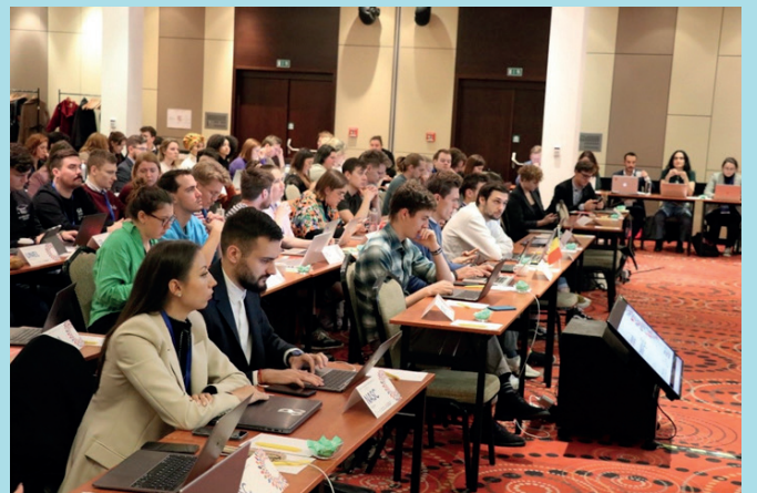
Plenární část 83. Board meetingu ESU Hotel DUO

Bylo též přijato prohlášení k akademické integritě. Dokument pokrývá oblasti, jako jsou problematika podvádění, ochrana dat, integrita ve výzkumu a vztahy mezi učiteli a studenty ve výuce i během akademické spolupráce. ESU vyzdvihla vzájemný respekt, dialog a vytváření bezpečného prostředí, kde se může realizovat každý. Na závěr vyjádřili delegáti a delegátky solidaritu se studenty v Íránu, kteří čelí ze strany tamního režimu zatýkání a fyzickým trestům.