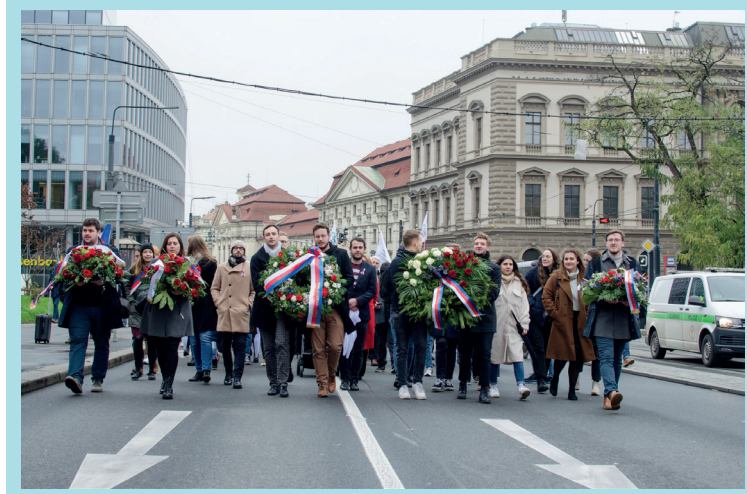
Studentský průvod od Hlávkovy koleje k památníku J. Opletala a V. Sedláčka