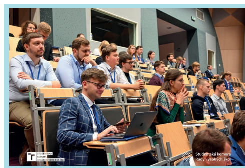
Účastníci KAS 9.0